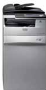
Corpo Macchina + Mobiletto