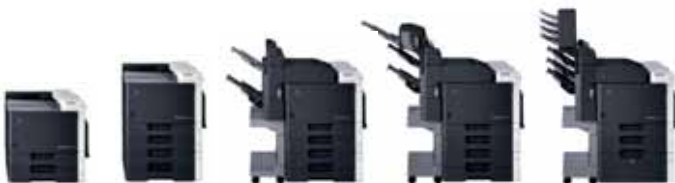
Corpo Macchina Corpo Macchina + 2 cassette carta Corpo Macchina + Finisher Corpo Macchina + Finisher + Kit Piegatura e pinzatura a sella. Corpo Macchina + Finisher + Mailbin